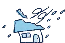
風災・雹災・雪災 *2