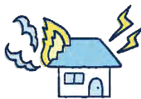
火災・落雷・破裂・爆発