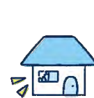
左記以外の 偶然な破損事故等

*2 「融雪水の漏入もしくは凍結、融雪洪水または除雪作業による事故」を除きます。 *3 床上浸水、地盤面より45cmを超える浸水、または損害割合が30%以上の場合があります。 *4 給排水設備に生じた事故による水濡れ、または他の戸室で生じた事故による水濡れをいいます。